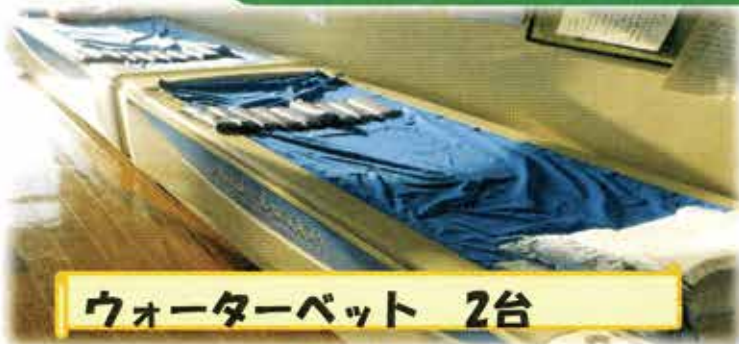
ウォーターベット 2台